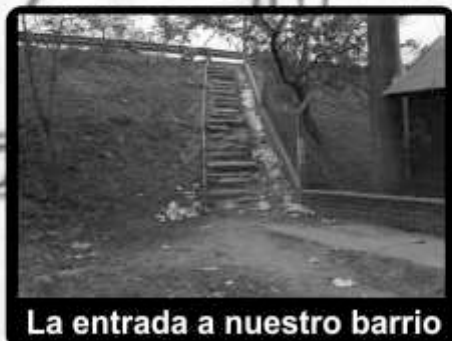
La entrada a nuestro barrio