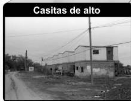
Casitas de alto