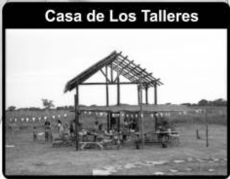
Casa de Los Talleres