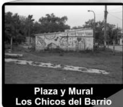
Plaza y Mural Los Chicos del Barrio