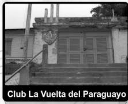
Club La Vuelta del Paraguay